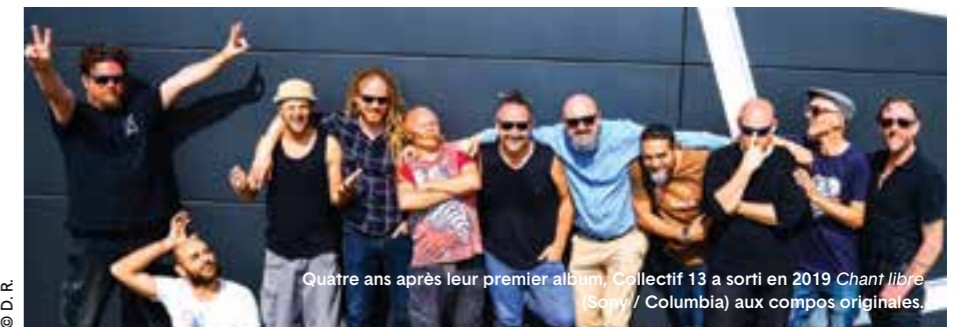
Quatre ans après leur premier album, Collectif 13 a sorti en 2019 Chant libre (Sony / Columbia) aux compos originales.

Site de Bosque, Apt / Pays d'Apt-Luberon (84). Du 31 mai au 2 juin. http://www.luberonmusicfestival.com/programmation/jours/