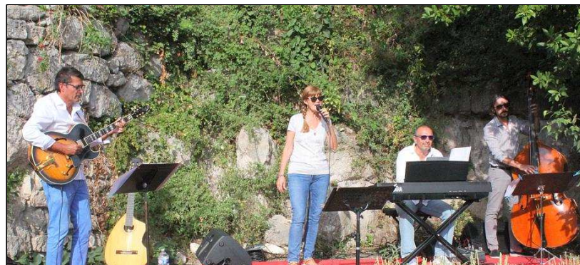
Mercredi, sous un ciel clément, le quartet Suzy and Kho a donné toute la mesure de son talent. Les amateurs du genre ont su profiter des mélodies inspirées du répertoire de Michel Legrand. Credit