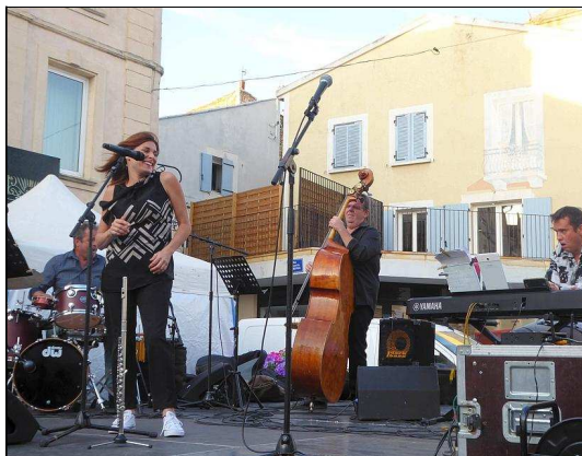
Apéro jazz place Taillade à Pierrelatte. Credit