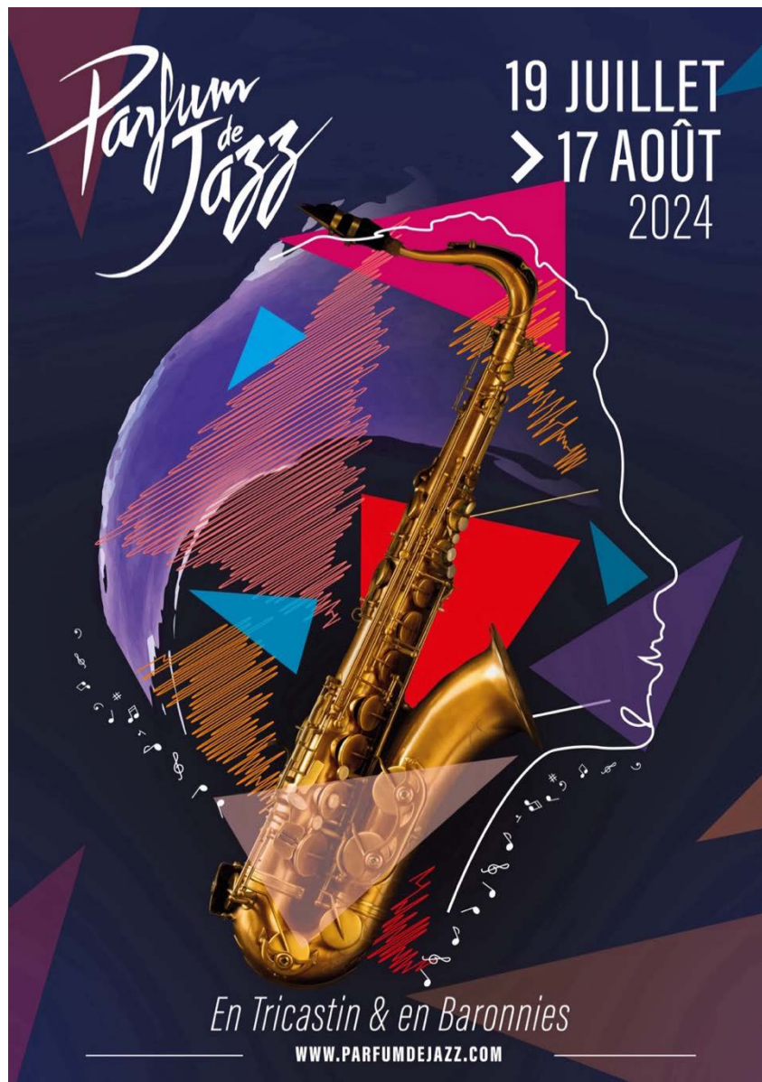
Affiche et graphisme – JL communication